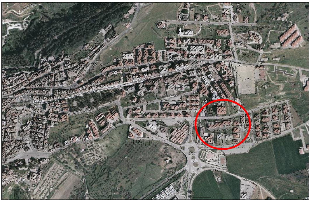
AREA D' INTERVENTO ———

Il piano degli interventi manutentivi del patrimonio edilizio dell'IACP, è essenzialmente delineato da quanto proposto nel programma triennale delle opere pubbliche in atto vigente. Esso è finalizzato alla valorizzazione e al mantenimento dello stesso patrimonio, composto da circa 9.000 alloggi e botteghe in più di 400 plessi, distribuiti nei 58 comuni della provincia, con un più ampio concentramento nella periferia della città di Catania, e parimenti distribuiti nelle aree pedemontane – Jonica e del Calatino.